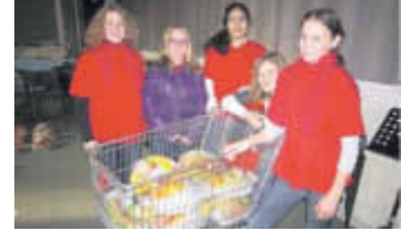
Jongeren van 'Samen het Honk' in actie tijdens DiaconAction 2011.

Honk. De jongeren zullen op zaterdag 16 november 2013 op drie manieren voedsel inzamelen. Zij staan in de Udense supermarkten EMTE, Plus en Albert Heijn tussen 09:00 en 16:00. Ook zijn er jongeren aanwezig tussen 09:00 en 16:00 in het Parochiecentrum, aan de Kerkstraat 25, te Uden om voedsel te ontvangen. Daarnaast staan de jongeren in het portaal van de Udense St. Petruskerk voor het begin van de Eucharistieviering van 18.30. "Wij willen graag samen met u iets goeds doen voor mensen