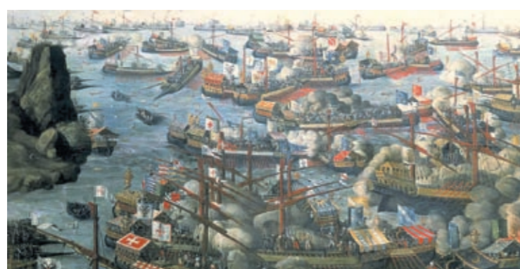
De slag bij Lepanto, 7-10-1571

Hoe het ook zij, op 12 oktober zal in de Birgittinessen kapel te Uden om 15.00 weer de Rozenkrans worden gebeden, of om nauwkeuriger te zijn, het Rozenhoedje. U bent van harte welkom om deel te nemen.