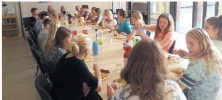
De vormelingen bijeen voor de gezamenlijke maaltijd.

Natuurlijk zal het versterken van de groepsvorming niet worden overgeslagen, bijvoorbeeld door bij elke bijeenkomst samen de maaltijd te gebruiken, waardoor alle deelnemers zich steeds meer thuis zullen voelen in de parochie. De eerstvolgende bijeenkomst van de vormelingen zal zijn op 7 november.